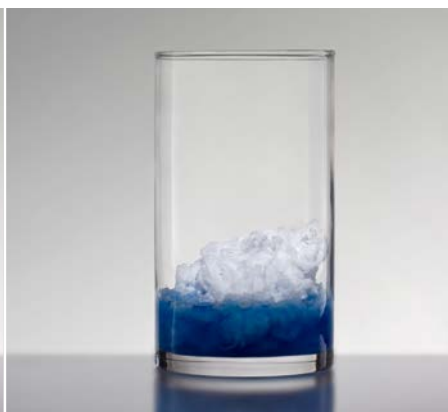
dazu DEUREX PURE