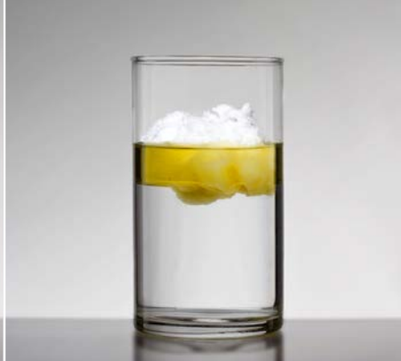
dazu DEUREX PURE