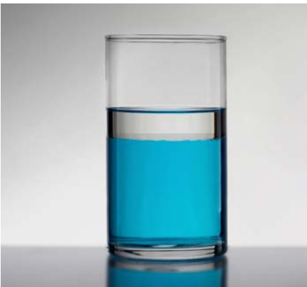
Wasser* verschmutzt mit Toluol

DEUREX Pure ist geeignet für hydrophobe Flüssigkeiten, für Öle und Chemikalien, auch Alkohole und Tenside.