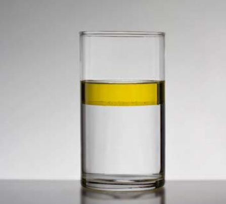
Wasser verschmutzt mit Diesel