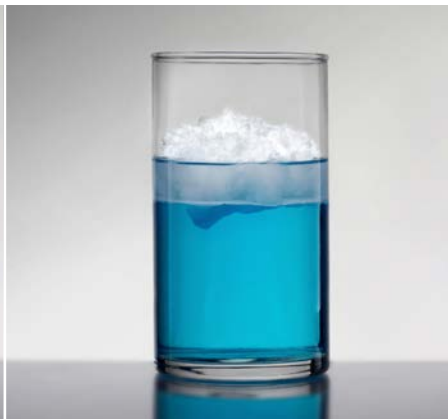
dazu DEUREX PURE