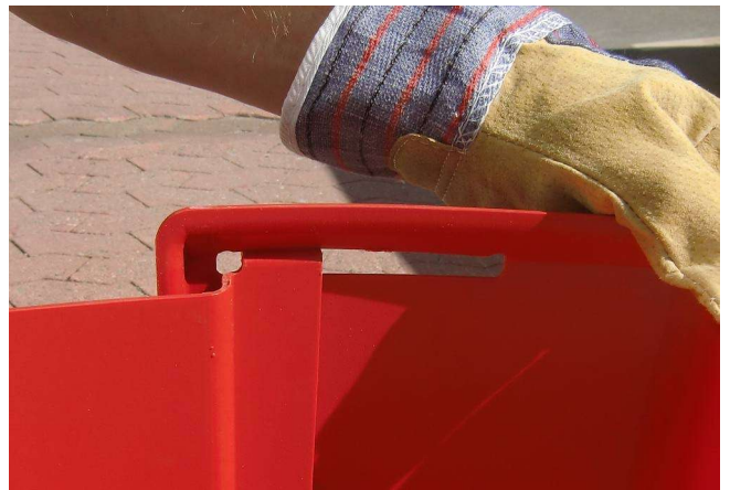
6. ...und anschließend hinten