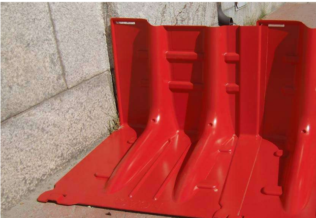
11. ...oder gegen hervorstehende Kanten...