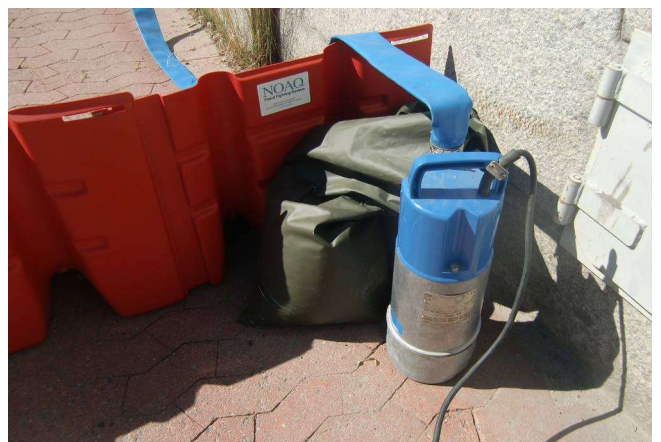
8. Pumpe bereitstellen für allfälliges Leck-Wasser