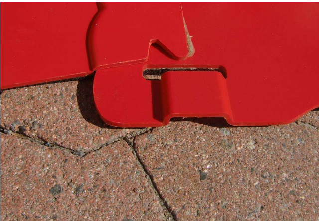
5. Verbinden der Boxen vorne ...