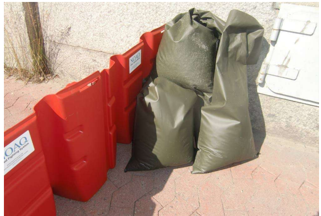
12. ...oder z.B. durch Sandsäcke o.ä.