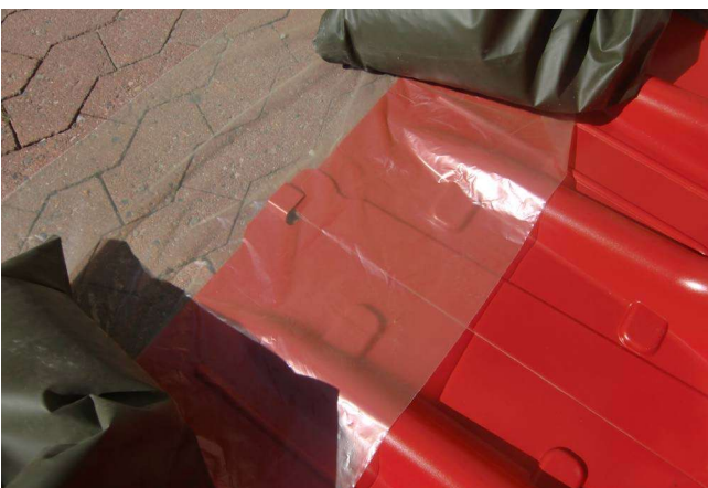
15. Auch die Abdichtung an der Unterseite kann so zusätzlich verbessert werden