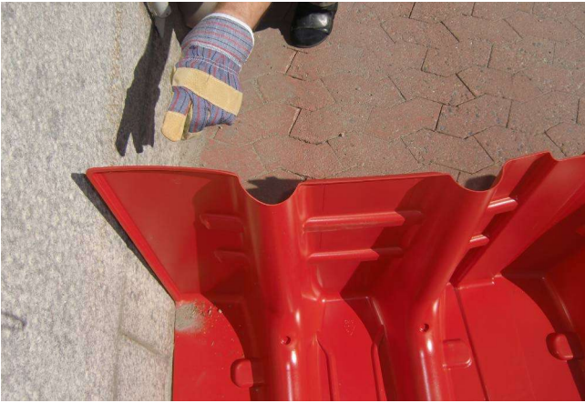
9. Ende des Walles von hinten abstützen...