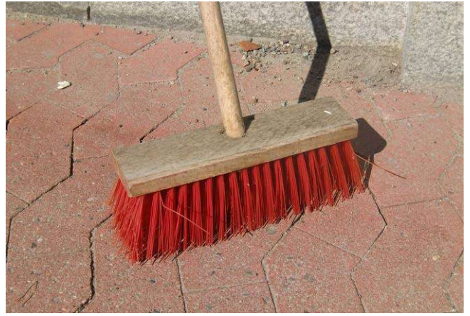
2. Der Untergrund muß eben und sauber sein (frei v. Sand usw.)