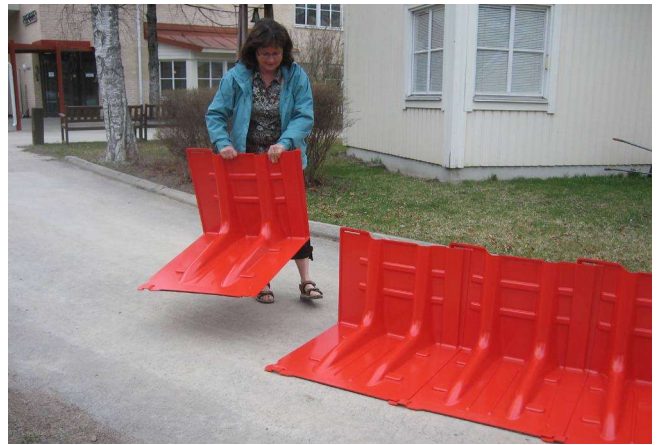
4. Aufbau von links nach rechts (gesehen v. der "Trockenseite")