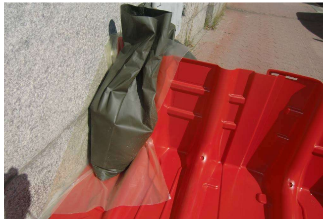
14. ...oder mit Kunststoff-Folie/Plane und Sandsäcken