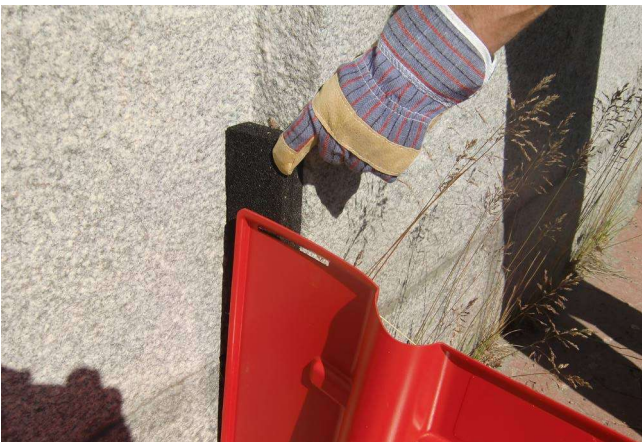
13. Außenverbindung mit Schaumstoff-Streifen abdichten...