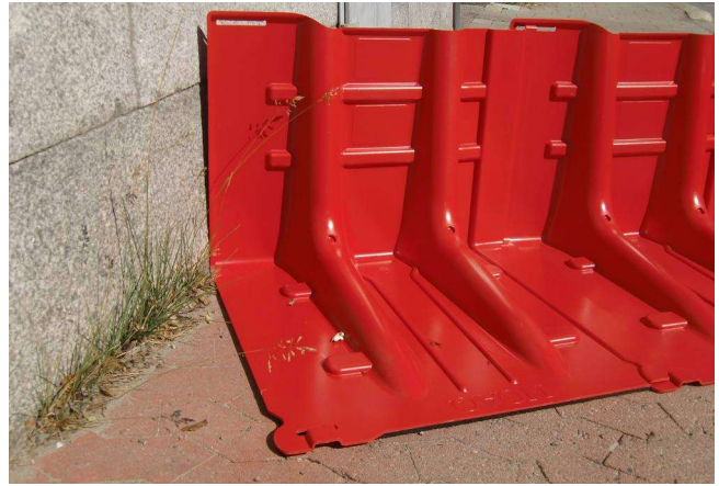
10. ...entweder durch Schrägstellen der Boxen gegen eine Wand