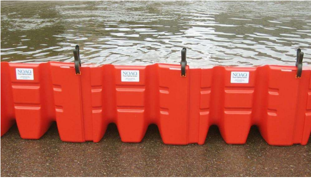
1. Ein NOAQ Boxwall ist ein temporärer Hochwasserschutz