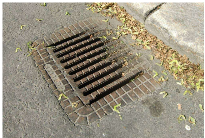
16. Auf Gullies, Abflüsse etc. achten und ggf. abdichten