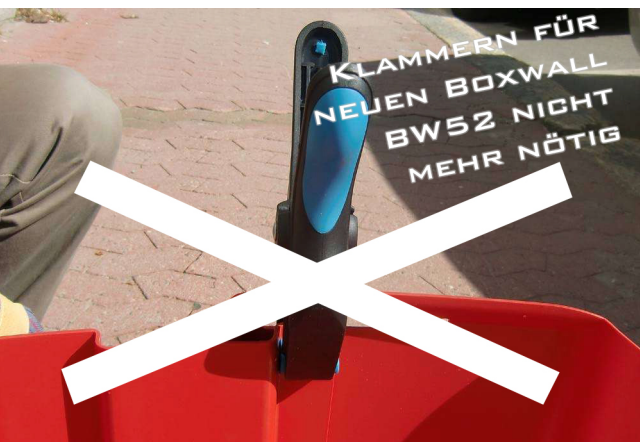
7. (Verbindungsklammer zur Absicherung zw. 2 Elementen)